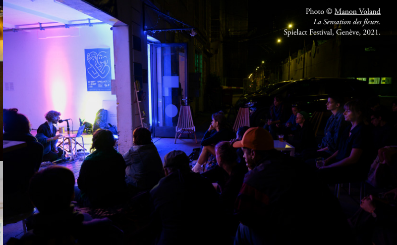
La Sensation des fleurs. Spielact Festival, Genève, 2021.