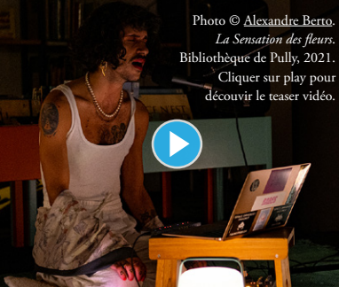
La Sensation des fleurs. Bibliothèque de Pully, 2021. Cliquer sur play pour découvrir le teaser vidéo.