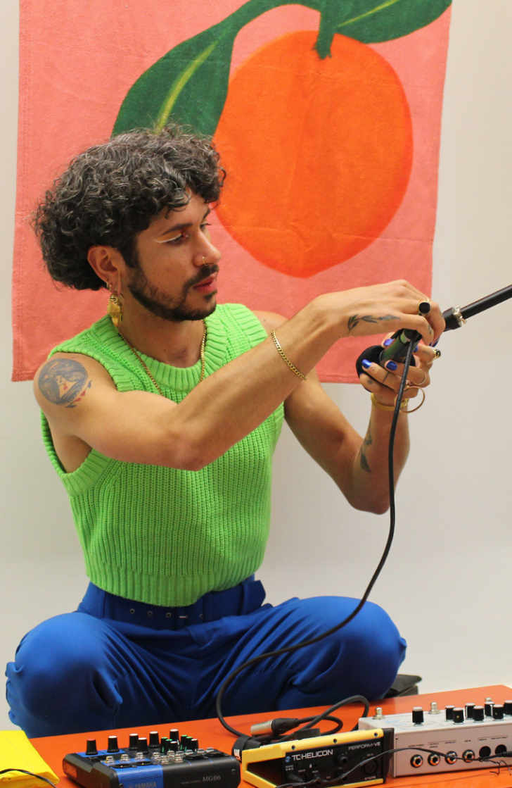
La Sensation des fleurs . Studio Les Amazones , Genève, 2022.