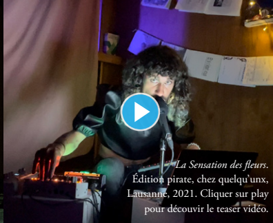
La Sensation des fleurs. Édition pirate, chez quelqu'un, Lausanne, 2021. Cliquer sur play pour découvrir le teaser vidéo.