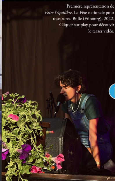
Première représentation de Faire l'équilibre . La Fête nationale pour tous-x-tes. Bulle (Fribourg), 2022. Cliquer sur play pour découvrir le teaser vidéo.