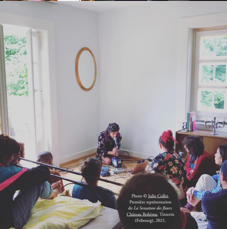
Première représentation de La Sensation des fleurs . Château Bohème, Tinterin (Fribourg), 2021.